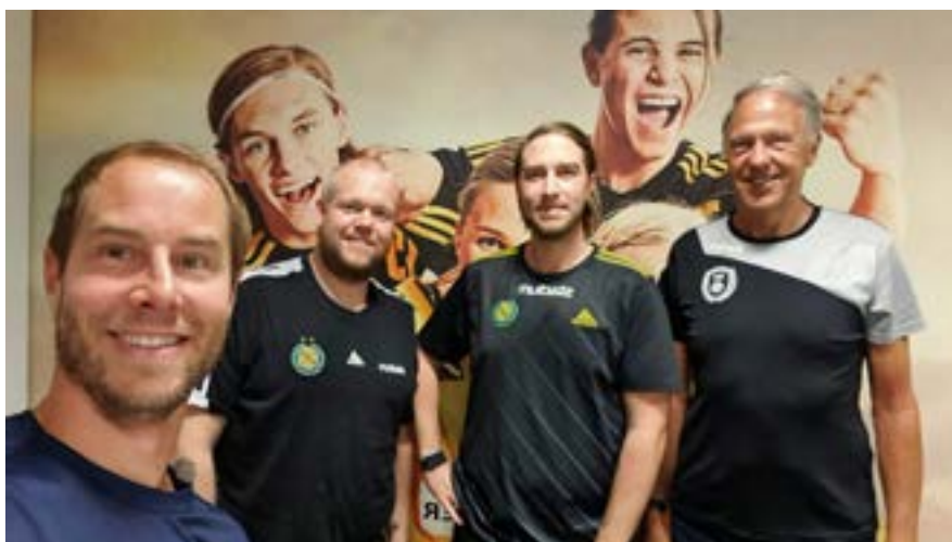
En utav alla föreningsträffar som har genomfört under året. Här en bild från besöket hos IK Sävehof.

Föreningsutveckling- och rekryteringskommittén