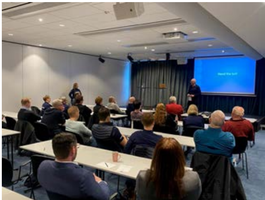
Den 14 januari 2023 hade förbundet en konferens för personal och förtroendevalda i samband med Handbolls-VM i Göteborg.