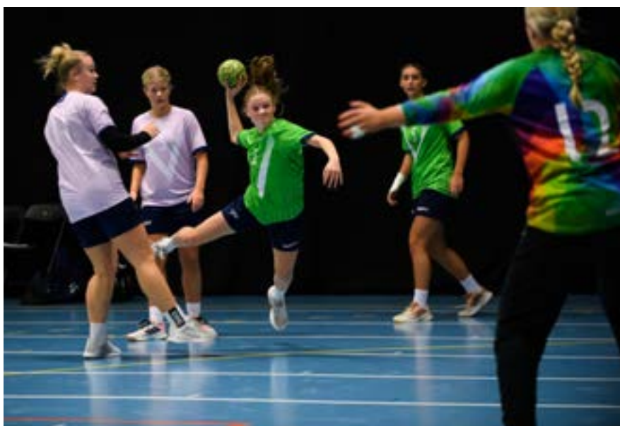
I november 2022 genomfördes Sverigecupen i Nyköping för spelare födda 2007. På bilden ser ni Väst lag Rosa mot lag Grön.